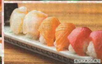
旬のおさげ入寿司