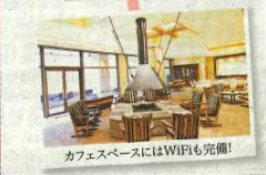
カフェスペースにはWiFiも完備!